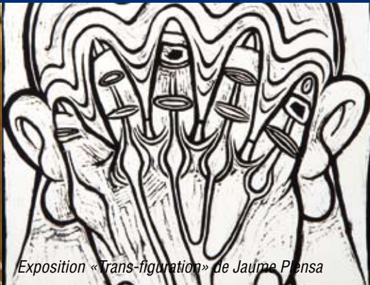
Exposition «Trans-figuration» de Jaume Plensa

Gratuit – Salle Pierre Satgé, Place Léon Blum Organisé par l'Entente Toulousaine Ornithologique (ETO) Renseignements au 05.61.51.91.59