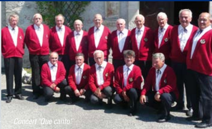
Concert "Que canto"