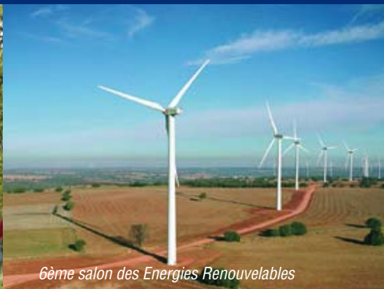
6ème salon des Energies Renouvelables