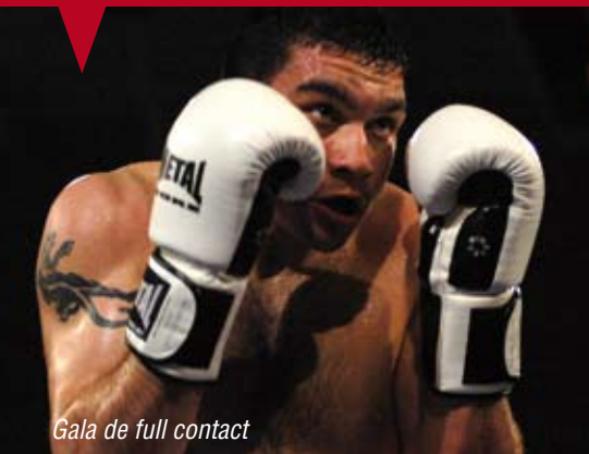
Gala de full contact