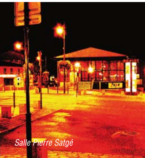
Salle Pierre Satgé