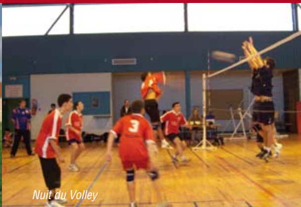
Nuit du Volley