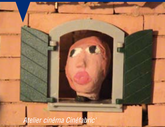
Atelier cinéma Cinéfabric'