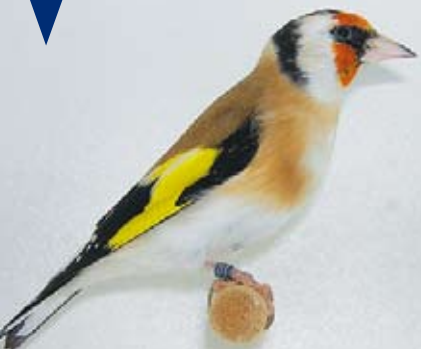
«Muret, ville d'Ader – Muret, ville des oiseaux»