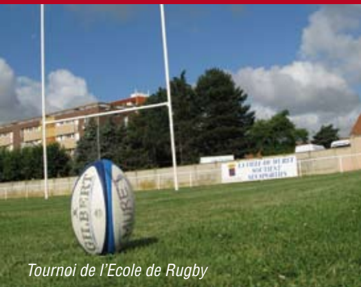
Tournoi de l'Ecole de Rugby