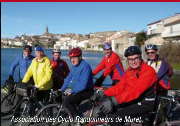
Association des Cyclo Randonneurs de Muret