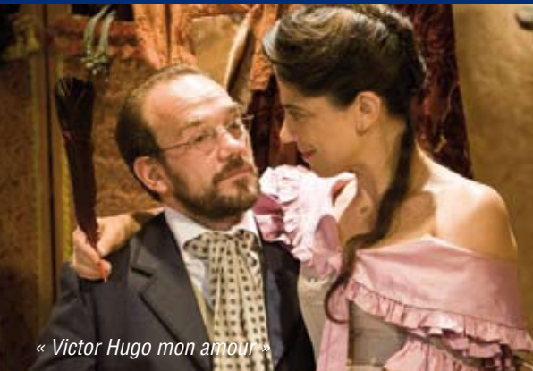
« Victor Hugo mon amour »