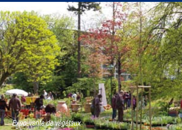
Expo-vente de végétaux