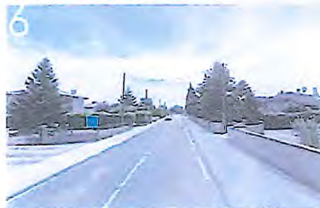
Projet trottoir (phasage PRO)