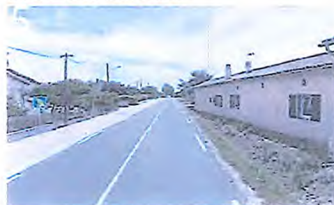
Voie verte - busage des fossés - RD 19