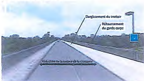
Piste cyclable dédiée - RD 19G