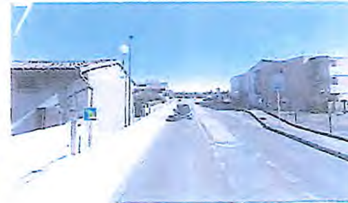
Voie verte, mobilier à enlever - RD 4