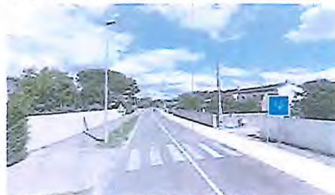
Piste cyclable dédiée ou voie verte pour multi-usages - RD 19