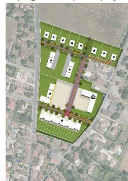
Document de travail